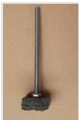
Śruba ze stali nierdzewnej z zaślepką

* W przypadku wzmocnienia korpusu komina zbrojeniem, należy zakończyć zbrojenie około 6 cm poniżej końca obudowy komina (ostatni bloczek z cegły lub pierścieni), a powyżej użyć śrub ze stali nierdzewnej z zestawu mocującego zgodnie z niniejszą instrukcją.